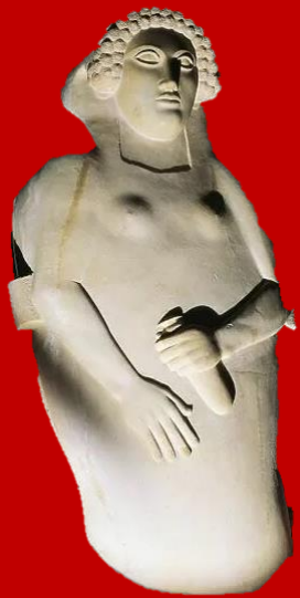
Sarcophage d'une femme en albâtre trouvé à Cadix, Art phénicien, Ve/IVe siècle av. J-C Musée de Cadix (Espagne)

Dans le cadre de l'initiative de la Région des Pouilles en faveur de la Route des Phéniciens, l'événement « De la Route au Territoire - Ateliers Créatifs de la Route des Phéniciens dans les Pouilles » a eu lieu à Bari, Fiera del Levante, les 11 et 12 juillet. Le premier jour, une « Réunion publique avec les acteurs culturels et touristiques de la région des Pouilles et des tour-opérateurs internationaux sélectionnés » s'est tenue pour planifier le développement de la Route des Phéniciens dans les Pouilles, en suivant les méthodologies typiques de la Route, en particulier le système Smart Ways. Dans l'après-midi, une « Rencontre réservée aux organismes publics locaux italiens adhérant à la Route des Phéniciens » pour faire le point sur les stratégies pour l'Italie pour la période 2022-2025 : gouvernance, idées, projets et visions, compte tenu également des célébrations du XX anniversaire de la Route des Phéniciens en 2023. Le matin du 12 juillet, une réunion publique des universités des Pouilles avec le Réseau International des Universités (IUN) de la Route des Phéniciens visait à échanger des méthodologies et des meilleures pratiques. Dans l'après-midi, un « Laboratoire d'Itinéraires Culturels pour la définition des lignes directrices sur lesquelles mettre en place l'Atlas des Itinéraires Culturels de la Région des Pouilles ».