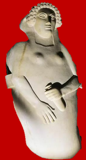
Sarcophage d'une femme en albâtre trouvé à Cadix, Art phénicien, Ve/IVe siècle av. J-C Musée de Cadix (Espagne)