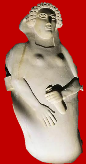
Sarcophage d'une femme en albâtre trouvé à Cadix, Art phénicien, Ve/IVe siècle av. J-C Musée de Cadix (Espagne)