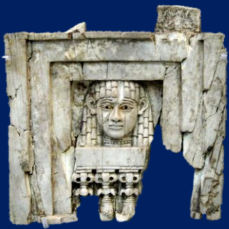
Plaque ivoire avec une femme à la fenêtre, de Nimrud (Irak), IX-VIII siècle avant JC ca. Le British Museum, Londres

Pour renforcer la réflexion et la mise en œuvre du thème de nos jours, la Route des Phéniciens présentera un Agenda de Genre, le premier créé par un Itinéraire Culturel du Conseil d'Europe, auquel sera dédié un un espace au sein du site web institutionnel.