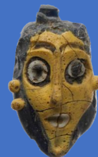
Pendentif en verre, époque phénicienne 650-550 avant JC Musée métropolitain d'art New York

Pour donner suite à l'Accord de Collaboration signé le 1er juin 2020 avec OITS America - Organisation Internationale du Tourisme Social, la Route des Phéniciens a lancé des activités de planification générale basées sur 4 axes: échanges culturels, échanges universitaires (coopération entre universités), échanges touristiques (promotion et commercialisation), échanges commerciaux. Un événement conjoint, le « 1er Forum euro-méditerranéen-américain - Tourisme social - Itinéraires culturels », est prévu en novembre 2021 en Espagne, accueilli par la Diputación de Pontevedra. Présentations, tables rondes, ateliers, circuits de visite sur le territoire sont prévus.