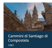
Cammini di Santiago di Compostela 1987