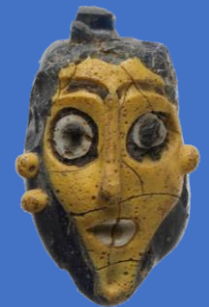
Pendentif en verre, époque phénicienne 650-550 avant JC Musée métropolitain d'art New York

Le Festival de littérature méditerranéenne de Malte est un festival littéraire international annuel organisé par l'Association Inizjamed, membre de la Route des Phéniciens, en collaboration avec le European Network Literature Across Frontiers et d'autres partenaires nationaux et internationaux, notamment le Conseil des arts de Malte, la Fondation Valletta 2018, Heritage Malte et le Programme Europe créative de l'Union européenne. Le Festival rassemble des écrivains et des traducteurs littéraires actifs de Malte, de la Méditerranée et étrangers, pour présenter l'écriture et la pensée contemporaines, promouvoir l'interaction entre les langues, les géographies et les genres artistiques, et discuter de principaux problèmes de notre temps. Tous les événements sont ouverts au public. L'événement se tiendra à Fort Saint Elme, les 27 et 28 août.