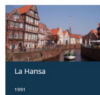
La Hansa 1991