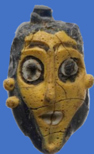
Pendentif en verre, époque phénicienne 650-550 avant JC Musée métropolitain d'art New York