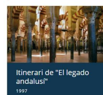
Itinerari de "El legado andalusi" 1997