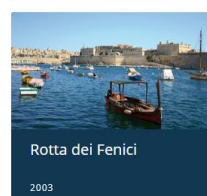
Rotta dei Fenici 2003