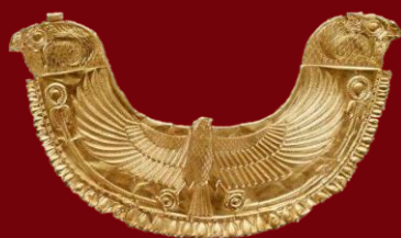
Collier d'or phénicienne trouvé à Byblos (Liban) 1750 avant JC Musée du Louvre (France)