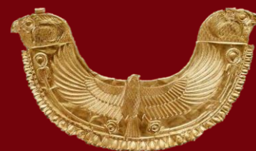
Collier d'or phénicienne trouvé à Byblos (Liban) 1750 avant JC Musée du Louvre (France)

Un accord de collaboration a été signé entre la Route des Phéniciens et le « Rete Museale e Naturale Belicina », l'association des musées du territoire du Belice qui forme un système muséal territorial très actif. Les objectifs de l'Accord sont la collaboration pour des initiatives visant à renforcer et améliorer la connaissance du patrimoine matériel et immatériel du territoire et de l'ensemble de la zone méditerranéenne, la promotion de formes de tourisme culturel, lent, créatif, responsable et durable, l'amélioration de la gestion et de l'utilisation des musées et des sites culturels concernés, également à travers des initiatives pilotes.