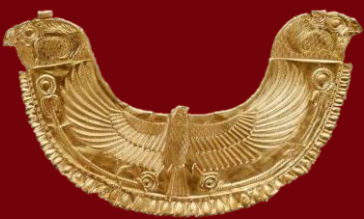
Collier d'or phénicienne trouvé à Byblos (Liban) 1750 avant JC Musée du Louvre (France)