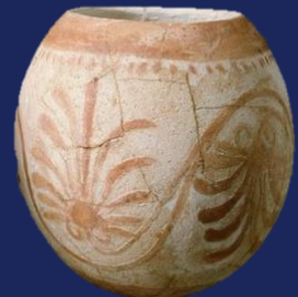
Oeuf d'autruche phénicien, peint 5ème / 4ème siècle avant JC Ibiza, Musée de Puig des Molins (Îles Baléares, Espagne)

La Route des Phéniciens célébrera cette journée avec un événement en ligne intitulé «Histoires des musées sur la Route des Phéniciens». Sur notre page Facebook, nous raconterons de 10 musées qui font partie du Réseau de la Route des Phéniciens à travers de courtes vidéos, photos et descriptions: une sorte de narration du musée. Ne le manquez pas!