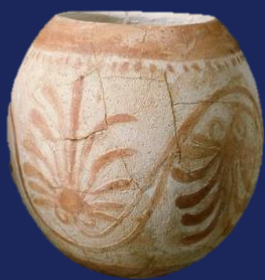
Oeuf d'autruche phénicien, peint 5ème / 4ème siècle avant JC Ibiza, Musée de Puig des Molins (Îles Baléares, Espagne)