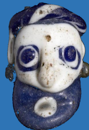
Perle de verre bleue et blanche en forme de tête d'homme barbu avec boucles d'oreilles, phénicienne, 6ème-5ème siècle avant JC.