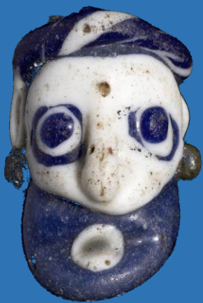
Perle de verre bleue et blanche en forme de tête d'homme barbu avec boucles d'oreilles, phénicienne, 6ème-5ème siècle avant JC.