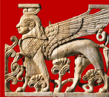
Plaque d'ivoire représentant un sphinx ailé phénicien, 9ème-8ème siècle avant JC