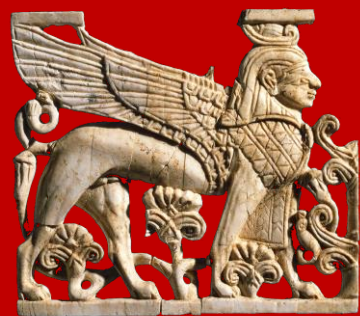
Plaque d'ivoire représentant un sphinx ailé phénicien, 9ème-8ème siècle avant JC