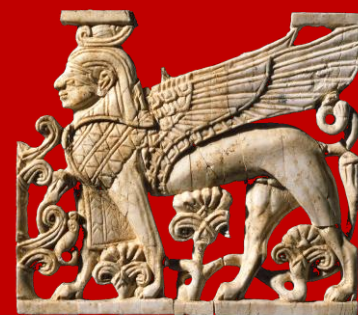
Plaque d'ivoire représentant un sphinx ailé phénicien, 9ème-8ème siècle avant JC