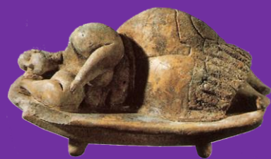
Madre Terra – Malta