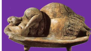
Madre Terra – Malta